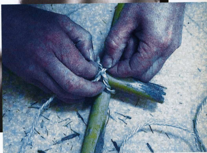
La germination de l'utopie (2001) de Dominique Comtat Marc Mercier

La première fois que je suis entré dans la prison des Baumettes à Marseille, c'était à la suite de mon article paru dans la revue Bref intitulé « Comment sortir du cadre ? » J'y ai rencontré un groupe de détenus qui participaient à un atelier de réflexion sur le cinéma, sous l'égide de l'association Lieux fictifs. Ils avaient lu mon texte et souhaitaient en débattre.